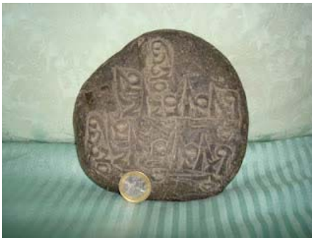
Una delle tre pietre con l'iscrizione

E' stata un'occasione bellissima e unica di cui serberò sempre il ricordo insieme all'insegnamento che l'autore ha voluto lanciare: fate sempre quello che amate, perchè la passione è l'unica cosa che vi può rendere soddisfatti.