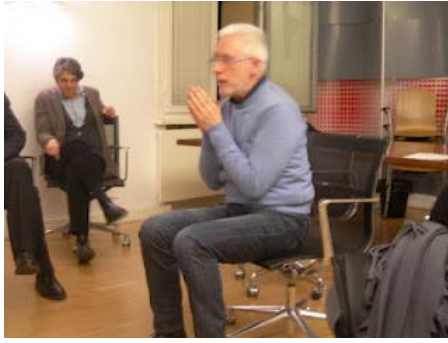
Alcuni momenti dell'incontro