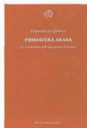
PRIMAVERA ARABA , di Domenico Quirico, Bollati Boringhieri, pp. 217, € 14

Una coppia di cinquantenni senza figli si trasferisce in Alaska. I due una mattina costruiscono una bimba di neve, con tanto di guanti e cappello. Da quella notte una vera bambina emergerà dalla foresta con una volpe e verrà a trovarli. Cambiando la loro vita.