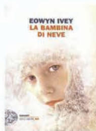
LA BAMBINA DI NEVE , di Eowyn Ivey, Einaudi, pp. 414, € 19

CARRIERA I libri, però, sono stati sempre la sua grande passione. E così, dopo essersi documentato soprattutto sul periodo della decadenza dell'Impero romano e su quello glorioso del Rinascimento italiano, nel 2007 abbandona ogni incarico nel mondo economico e si dedica esclusivamente alla scrittura di romanzi. Il grande successo lo premia nel 2009 con la pubblicazione del thriller storico 999 L'ultimo custode , uscito in 16 Paesi di 4 continenti.